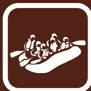
RAFTING / ADRENALINSKI URIZAM