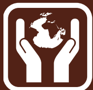
ZAŠTITA ŽIVOTNE SREDINE