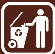
PRIMARNA SELEKCIJA OTPADA