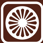
PROMOCIJA ROMSKE KULTURE